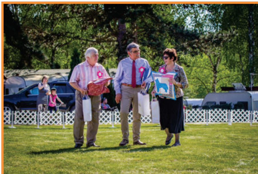
Rozhodčí na Klubové a CAC výstavy 2018