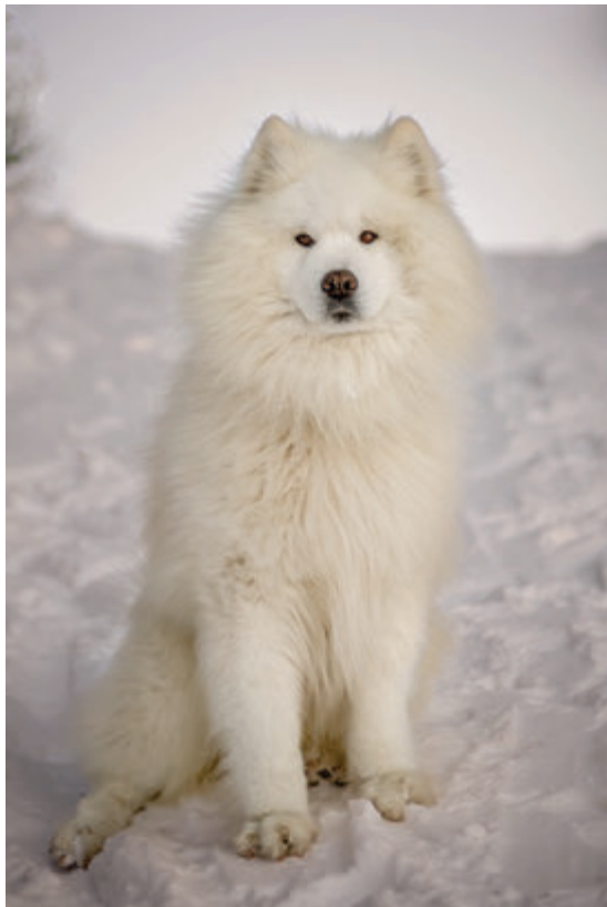
Alexander Great Carpathian white smile maj. Matuš Lehotský

Výstavní pes musí být zvyklý na ledasco. Používejte odměny, zvýšíte pracovní motivaci psa (kousek piškoty, psí kreky, páreček a pod.); psa můžete odměňovat i na výstavě v kruhu, mezi jednotlivými fázemi vystavování - nikde to není zakázáno. Motivací může být i velmi malá, ale oblíbená hračka (myška, gumová kulička, látkový sáček ...).