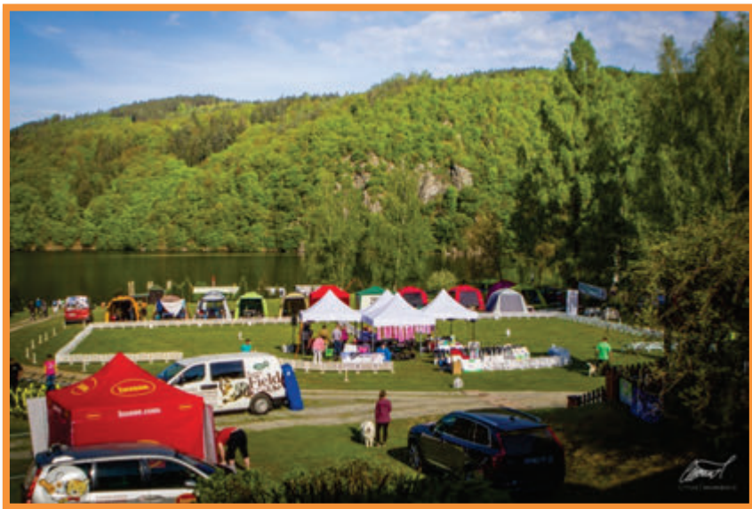
Kruhy a prostředí kempu