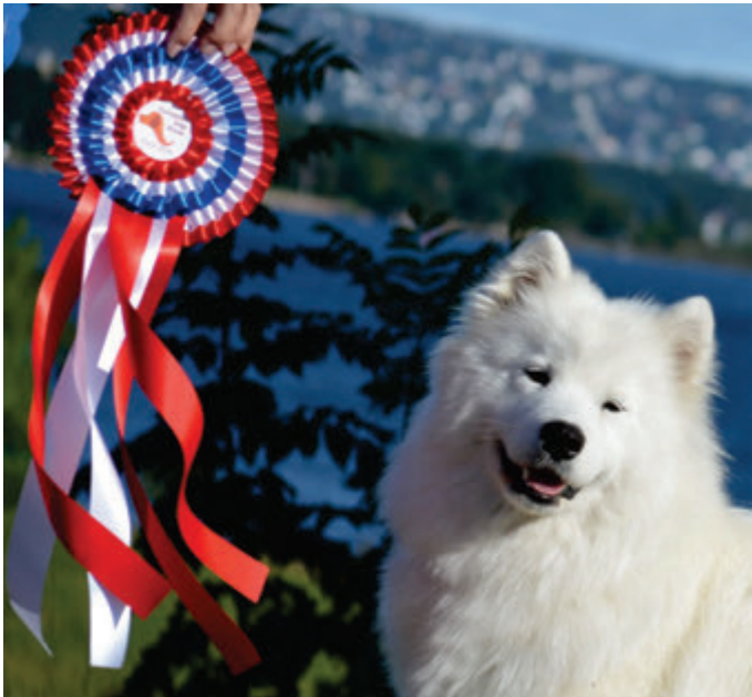
Mikee of Rose Vidnavská záře

jsem i při přehazování myslela na zdraví hafulí a spíše než přehazovala, jsem je spouštěla do tújí. A když jsem viděla, že se na druhé straně zase v pohodě smějí a vrtí ocasem, rozhodně mě zlost neopouštěla, a to ještě ten náš Pipin Xaver na mě hulákal, ať rychle slezu z toho plotu, aby mě neviděli sousedi! Čím víc jsem na něj řvala, aby přestal štkat, tím víc jeho hlas přidával na síle.