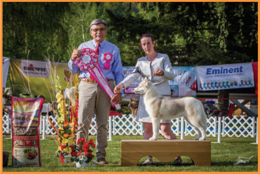
SH / BIS BABY - CAC výstava KSP 2018 - Winter Melody Big Bang Trouble, maj. Gorska Ewa