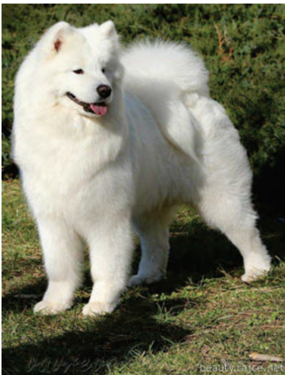
Arctic Aivik Furry Rose Vidnavská záře

Ze začátku jsem si říkala, že aspoň na vlastní kůži vyzkouším všechny své rady, které dávám novým majitelům našich štěňátek ohledně výchovy a výživy. Přála jsem si velmi temperamentní fenku plnou života a energie... Neměla jsem ani