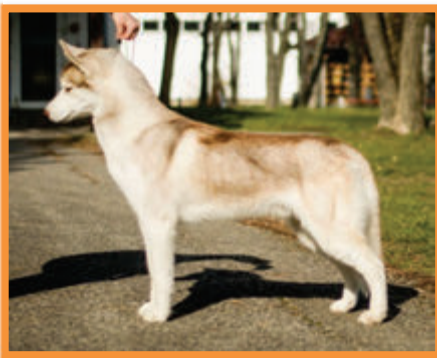
Coin Operated Boy Arctic Devil