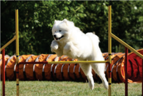
Albert Sněhový zázrak - agility

Posledním kouskem Rose byl Infadolan, pro neznalé mast na hojení ran v kovové tubě. A jestli si někteří myslí, že si snad dala práci mast vymačkat, jsou vysoce na omylu, sežrala ji i s tubou... a paradoxně náš plastožrout nechal jen vršek z umělé hmoty a kousek tuby, na kterém byl našroubován, abych jako viděla, že fakt nemá