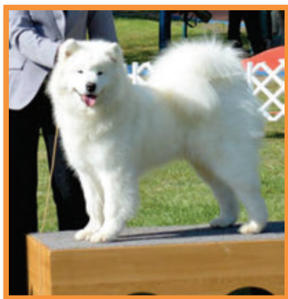
Pink of Mikee Vidnavská záře