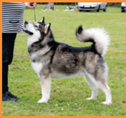
Iron Northern Shadows from Vlci severu