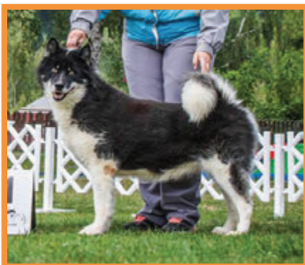
Layak Gronland Angakok