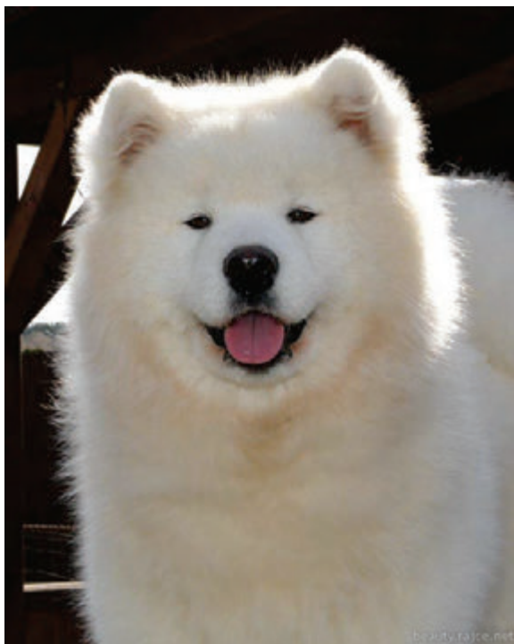
Pink of Mikee Vidnavská záře

Dva z nás taky byli i v zahraničí. Sami. Páník opravoval před brankou auto a nechal ji pootevřenou. Měl hlavu strčenou v motoru, Xavin s Esterkou toho hned využili. My jsme to už nestihli, páník branku zabouchnul. Ani jsme neštěkali, abychom neprozradili, že utekli. Páníček odjel spokojeně do práce. Najednou přijel nějaký pán, divně mluvil a prý, že paničce utekli psi. Ona, že ne, že je má všechny doma.