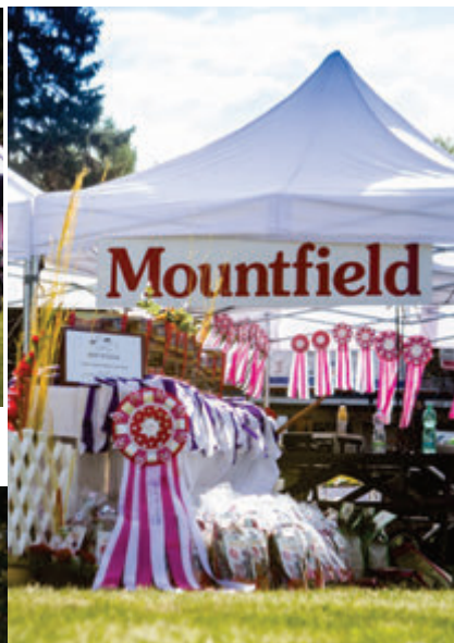
Kokardy a ceny pro vítěze