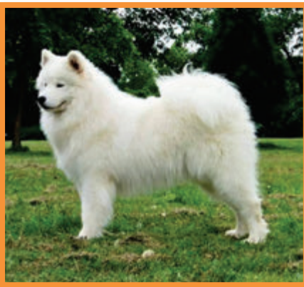
Dagan Adorable Smile