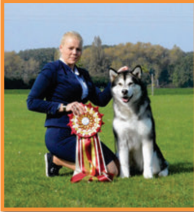
Chaos lam What lam Shamanrock