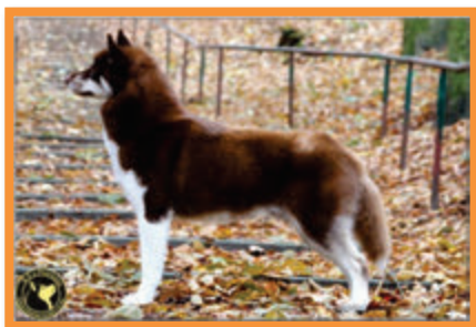
Fashion in Style Velnio Malunas