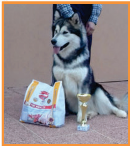
Janine Vlci severu