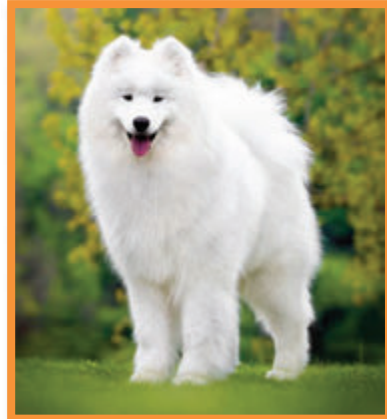
New Challenge for Orleansnow