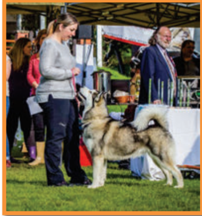
Angel of Ice Devil's Head