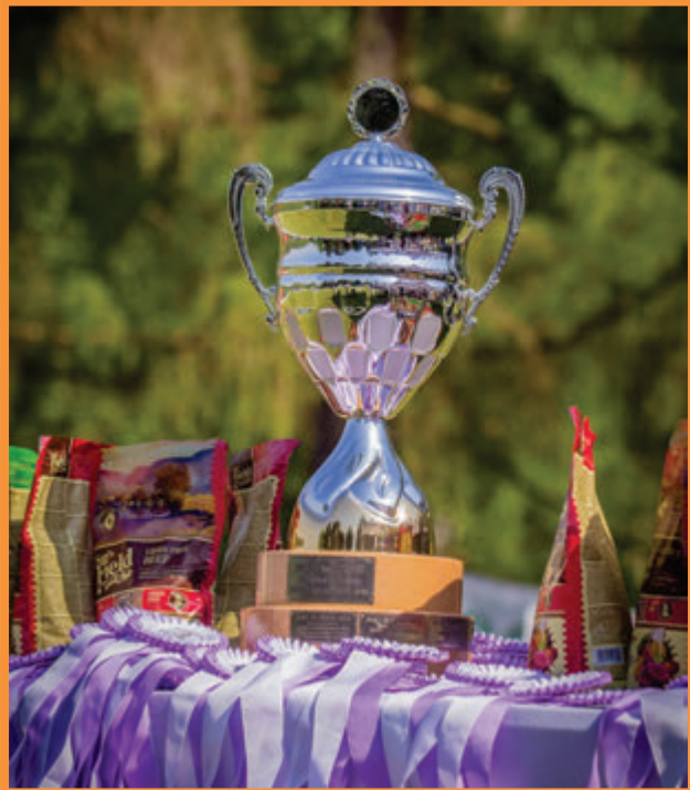
Ceny pro vítěze